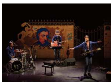
GAINSBURG FOR KIDS