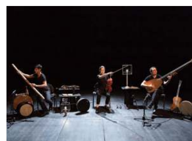
LA BELLE AU BOIS DORMANT