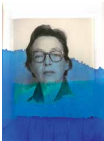
« Encre assassine », 2014 de Thu Van Tran Livre, bleu de méthylène. 26 x 42 cm (Détail) Portrait de Marguerite Duras issu de la collection Jean Mascolo

Bibliothèque publique d'information / Centre Pompidou 75197 Paris Cedex 04