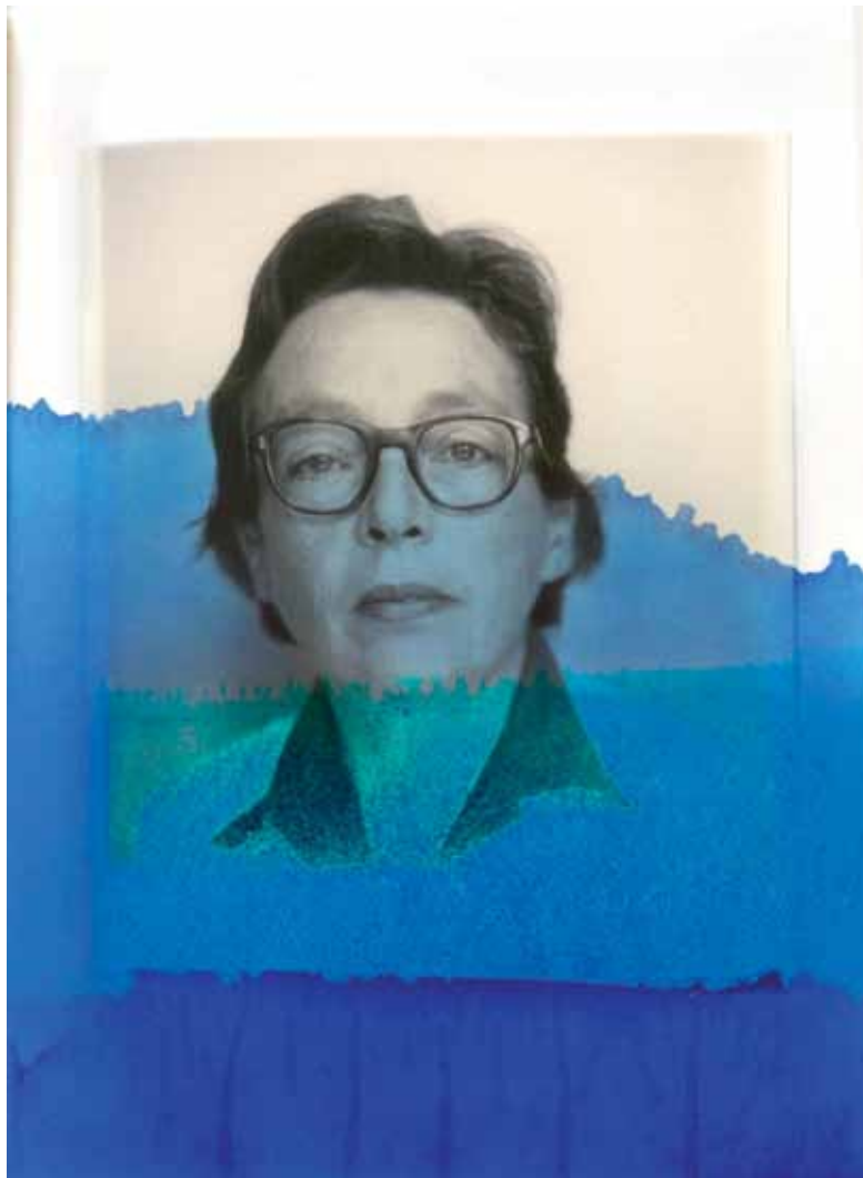
« Encre assassine », 2014 de Thu Van Tran Livre, bleu de méthylène. 26 x 42 cm (Détail) Portrait de Marguerite Duras issu de la collection Jean Mascolo