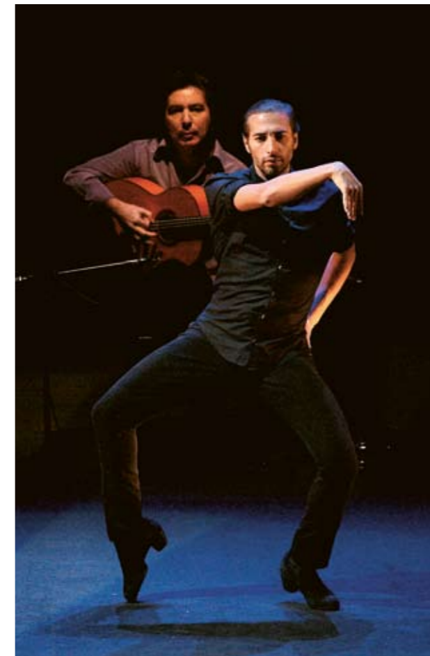
Israel Galván