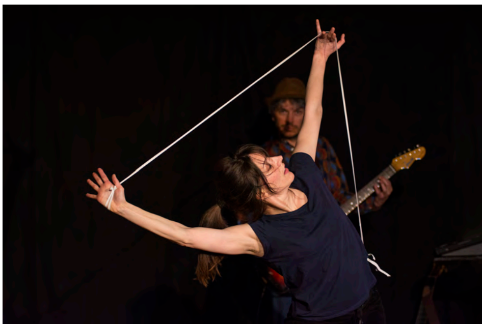
Il court, il court le Furet

Travaux manuels – Compagnie Tancarville - Spectacle musical et gestuel à 4 mains à partir de 2 ans - Durée 30 min