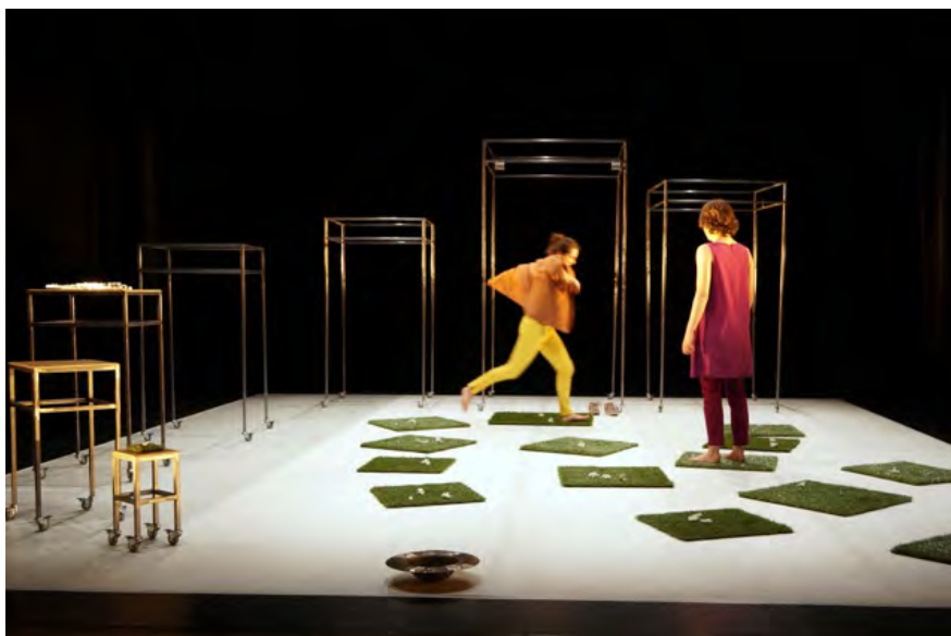
Jardin d'idées #2

Vendredi 24 février - 15h30 : Espace Grésillons