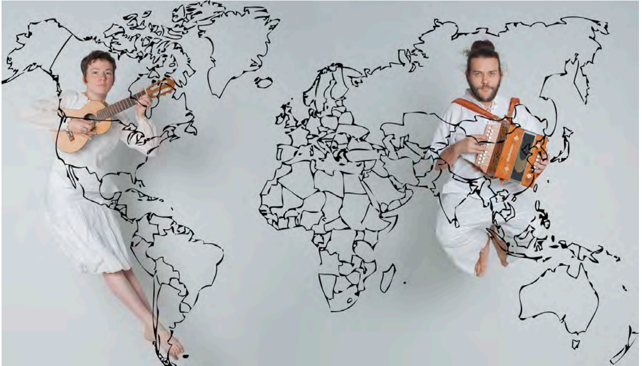
Tourne le monde

Le Festival Jeune et très jeune public est né avec l'objectif de permettre à des compagnies de présenter leur travail devant un public et aussi devant des programmeurs.