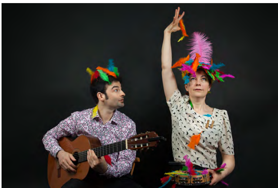
Bla Bla des belles bulles

En 2017, le Festival fêtera sa 3 ème édition.