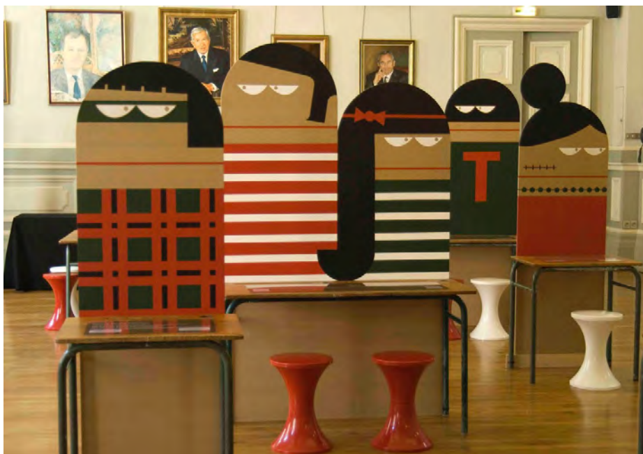
La main dans le sac à patates

Exposition « La main dans le sac à patates » dès 7 ans – du 1 er au 31 mars à la médiathèque François Rabelais- Vernissage mercredi 1 er mars à 16h30