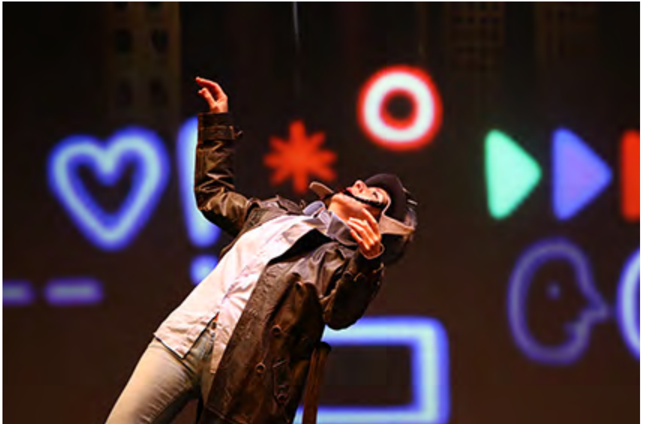
Tombé du ciel© François Côme