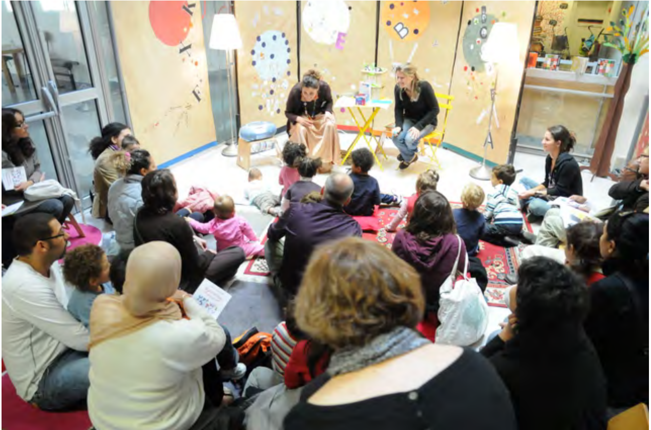
Les Racontines

La Ville de Gennevilliers a une longue tradition de politique culturelle envers le jeune public. Bibliothèques, Conservatoire de Musique et de Danse, Cinéma, Ecole Municipale des Beaux-arts, l'accès à la culture pour tous et notamment pour les plus jeunes est depuis longtemps considéré à Gennevilliers comme un facteur déterminant de l'émancipation individuelle.