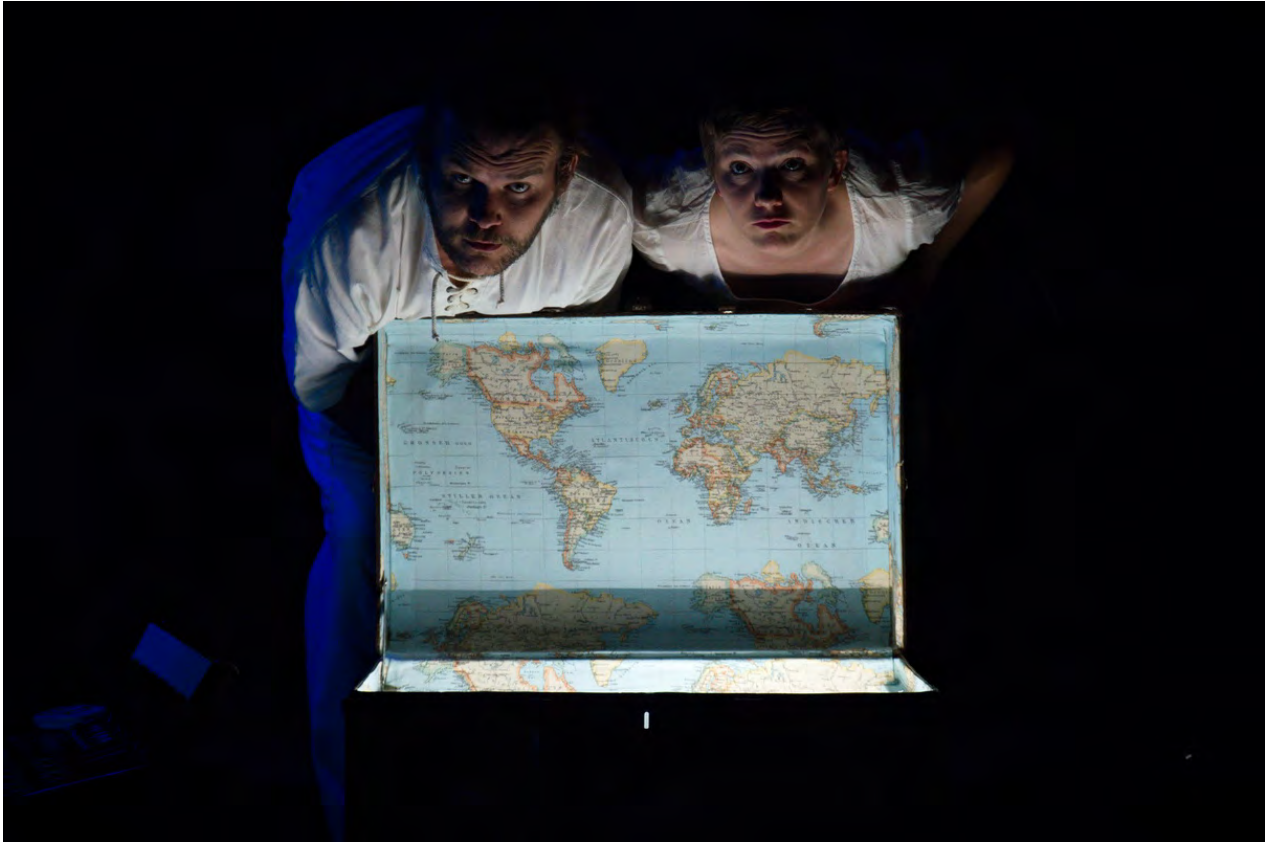
1,2,3 nous irons