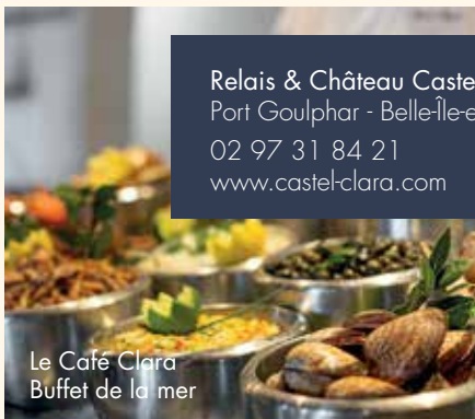
Le Café Clara Buffet de la mer

Relais & Château Castel Clara Port Goulphar - Belle-Île-en-Mer 02 97 31 84 21 www.castel-clara.com