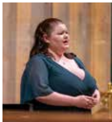
India Lord Mezzo-soprano