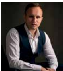
Ihor Mostovoi Baryton basse