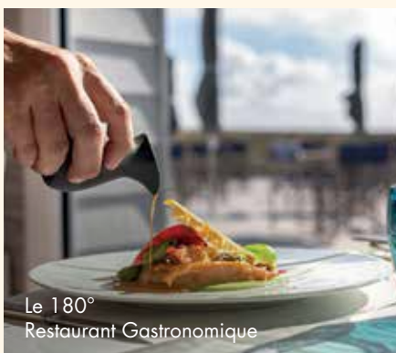
Le 180° Restaurant Gastronomique

Relais & Château Castel Clara Port Goulphar - Belle-Île-en-Mer 02 97 31 84 21 www.castel-clara.com