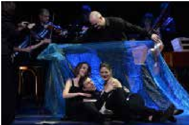
King Arthur Sirens Paris BarokOpera © BarokOpera