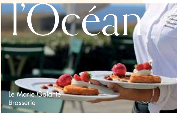
Le Marie Galante Brasserie

Hôtel Le Grand Large Goulphar - Belle-Île-en-Mer 02 97 31 80 92 www.hotelgrandlarge.com