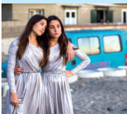
Indivisibili Indivisibles de Edoardo De Angelis 104'