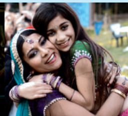
Babylon Sisters Babylon Sisters de Gigi Roccati 85'