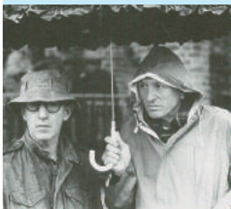
Acqua e Zucchero De l'eau et du sucre de Fariborz Kamkari 90'