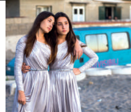
Indivisibili Indivisibles de Edoardo De Angelis 104'

Film d'ouverture Indivisibili Indivisibles