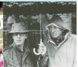
Acqua e Zucchero De l'eau et du sucre de Fariborz Kamkari 90'