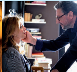
Piccoli crimini coniugali Petits crimes conjugaux de Alex Infascelli 90'