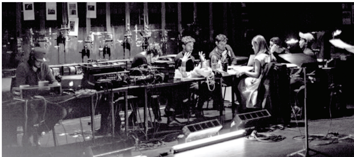
Thyeste de Sénèque, mise en scène de Thomas Jolly (en répétition)

Partenaire fidèle du Festival d'Avignon, la Région SUD - Provence-Alpes-Côte d'Azur vous donne rendez-vous à Avignon du 9 au 14 juillet sur la Péniche régionale amarrée Porte de la Ligne. Maison éphémère de la Région, elle sera un lieu de convivialité et de débats ouvert aux acteurs culturels et proposera un programme de rencontres mettant en valeur son territoire et son action.