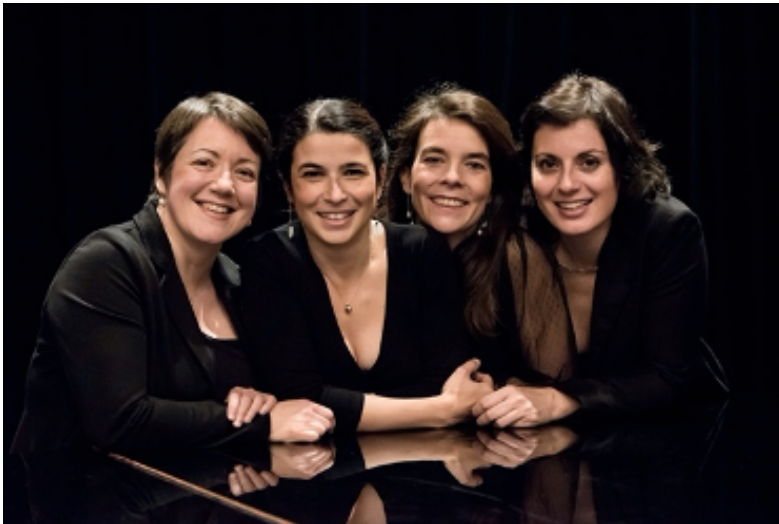
© Le quatuor Face à Face

Quatre femmes, quatre muses, quatre interprètes pour créer quatre compositeurs d'esthétiques et d'univers différents. De l'énergie joyeuse du célèbre West Side Story de Leonard Bernstein à la nouvelle œuvre d'Alexandro Markeas, le quatuor Face à Face convoque les rites, les rythmes, les incantations et les danses. Ces quatre musiciennes puisent l'énergie aux racines du son, convoquent les mythes pour un programme fait d'éclat et de célébrations joyeuses.