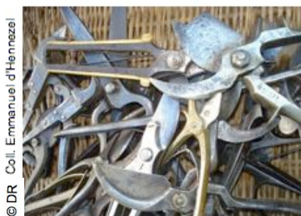
Amas de sécateurs anciens

Depuis les temps préhistoriques les hommes utilisent des outils pour cultiver la terre, les textes du Moyen Âge les nomment et les décrivent mais c'est aux XVIII e et XIX e siècles que les progrès sont les plus importants. Aujourd'hui encore, de nombreuses améliorations sont apportées aux outils, le jardinier a accès à de nouvelles techniques, comme l'informatique, pour s'occuper du jardin.