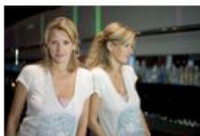
Design by Sarah Lavoine Présenté par Sarah Lavoine Le dimanche à 20h40