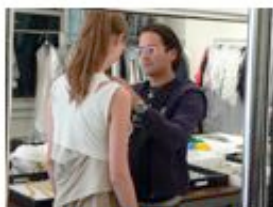
Louis Vuitton & Marc Jacobs Documentaire