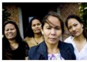
Mariages sur commande Documentaire inédit