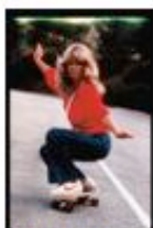
Farah Fawcett Documentaire inédit