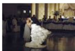
La fée des noces Série-documentaire inédite