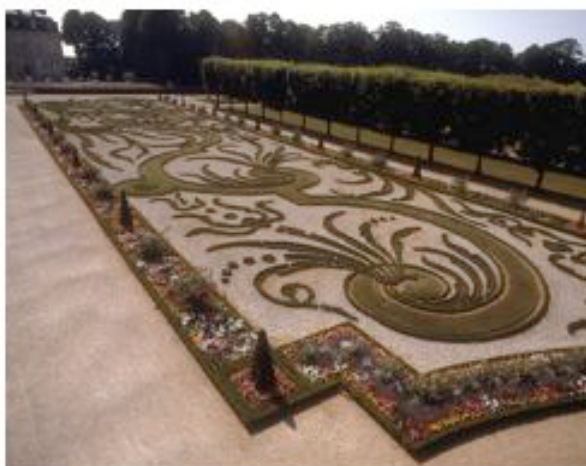
Château de Champs-sur-Marne