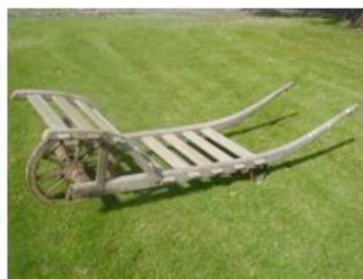
Brouette en bois, dite « à tombeau », 2m de long servant aussi bien au jardin qu'au transport de cercueil, fin 19 e