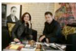
Coulisses d'un magazine Série-documentaire inédite