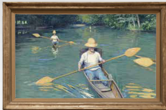
Périssoires sur l'Yerres