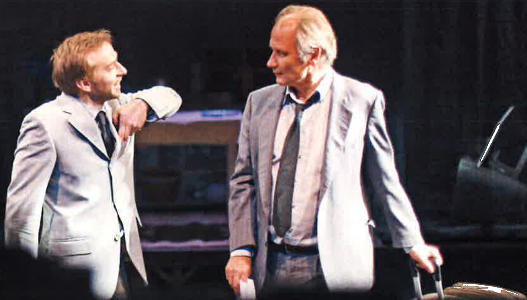
Jeremias Nussbaum et Hippolyte Girardot photos de répétitions