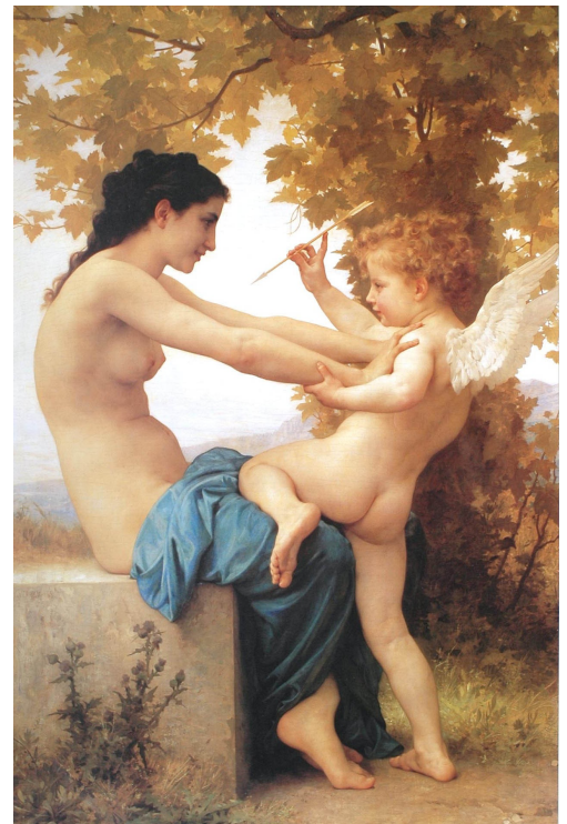
William Bouguereau, Jeune fille se défendant contre Éros, 1880

Natalia Petrovna, la maîtresse de maison, séduite par la jeunesse de l'étudiant, reproche à Rakitine, ami de la famille, d'être le représentant de ce milieu maladif et de l'ennui qui suinte du salon. Sa pupille, Véra, tombe également amoureuse de Beliaev. De l'enfant naïve qu'elle était au début de la pièce elle se transforme en une jeune femme décidée. Les tentions s'accumulent tel un ciel qui se charge. Et comme un orage d'été, le conflit disparaît aussi brusquement qu'il éclate. Ainsi à la fin du Mois à la campagne , Islaïev et sa mère se demandent avec stupéfaction ce qui a bien pu se passer dans leur maison.